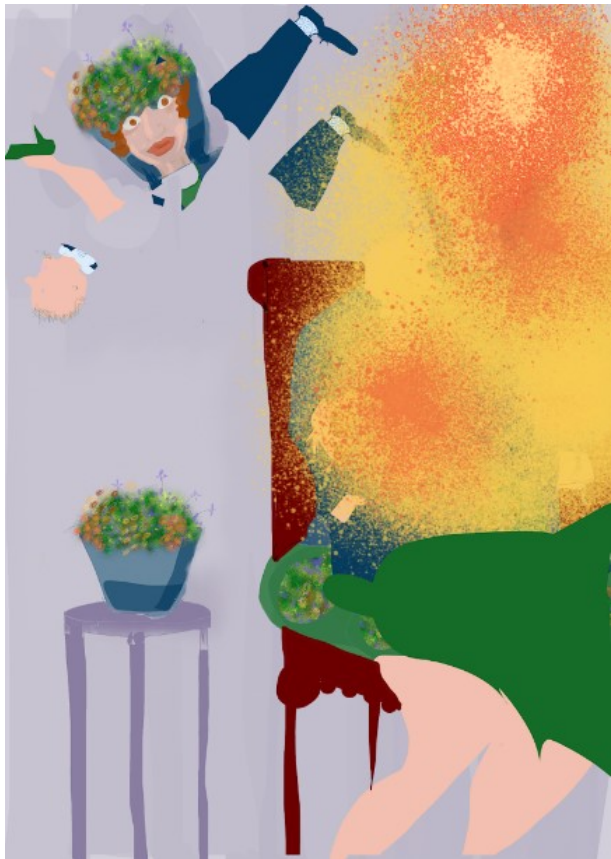
6. O, pardon, knal..