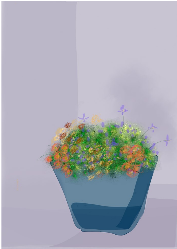
1. Een bosje bloemen op tafel. Helenium, chrysanten en clematis.