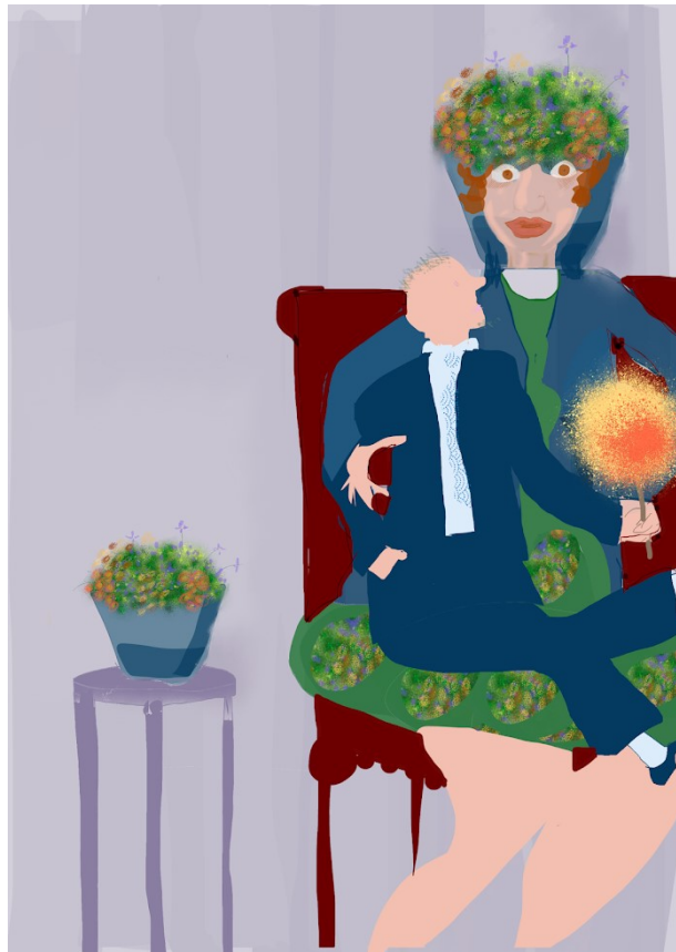
5. Gezellig bij haar op schoot.